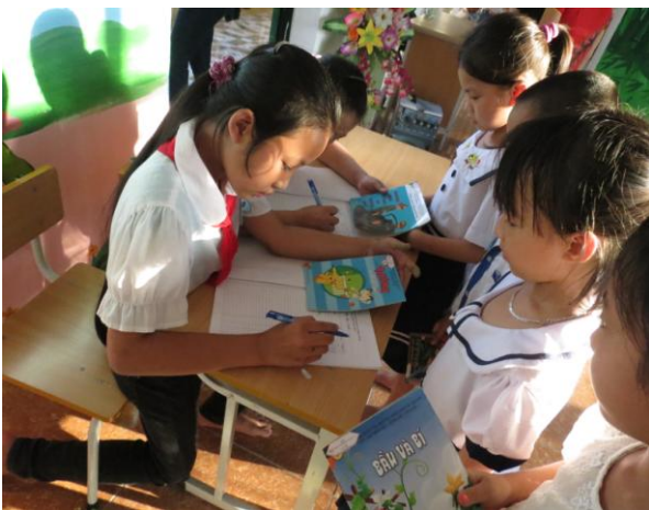
Nhóm trẻ nòng cốt hướng dẫn mượn sách