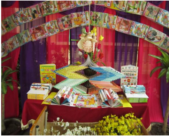
Tổ chức trưng bày, giới thiệu sách