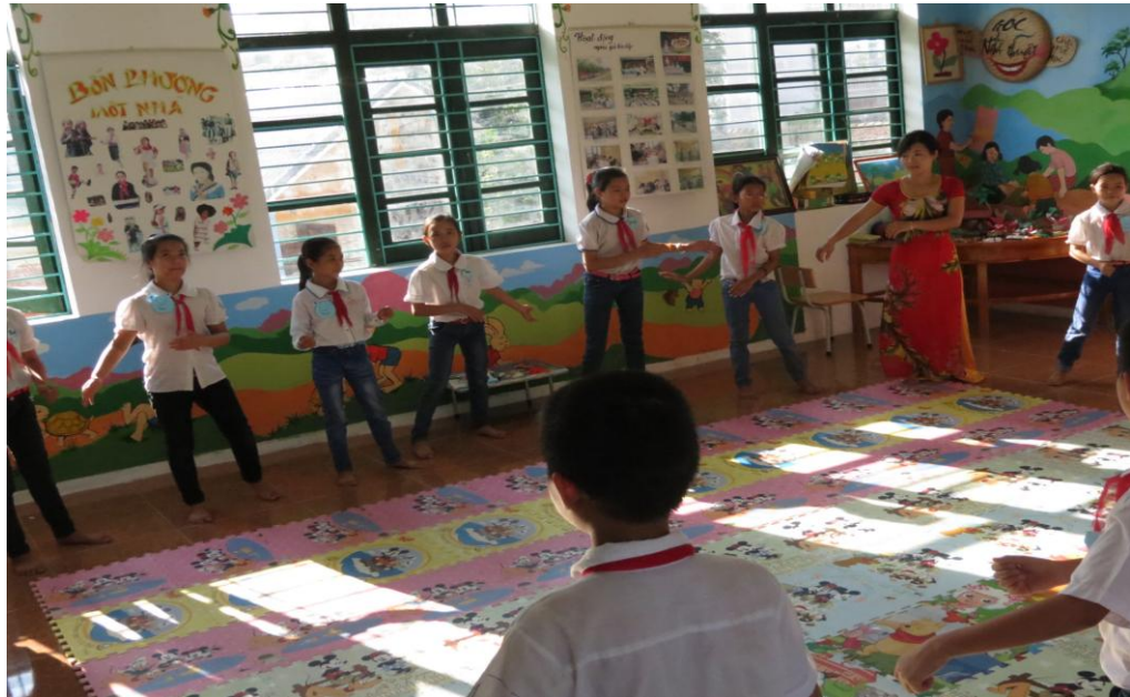
Hình ảnh: Cán bộ thư viện hướng dẫn học sinh nhảy theo nhạc.

Bài tập 3: ( 20p) Các nhóm sẽ thi với nhau diễn lại lời thoại giữa Dế Choắt, Dế Mèn và Chị Cốc.