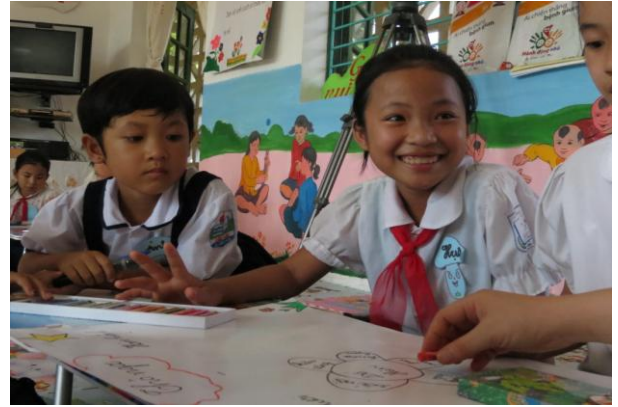
Hình ảnh: Học sinh vẽ tranh các nhân vật trong truyện.