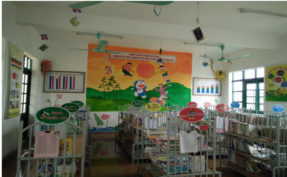
Hình ảnh: Kho sách thư viện trường Tiểu học Cẩm Vân.