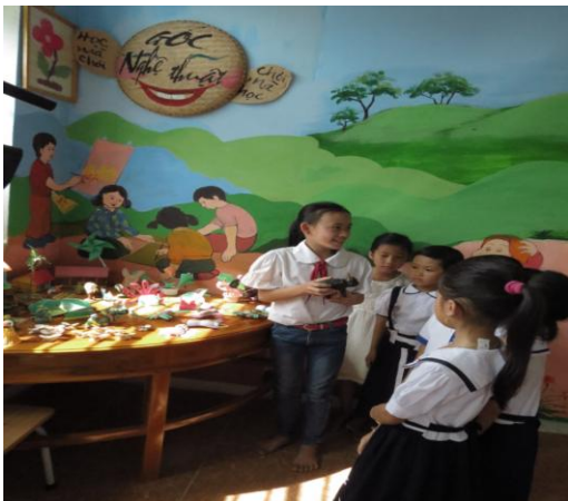
Học sinh giới thiệu về góc nghệ thuật