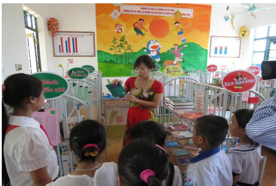
Hình ảnh: Cán bộ thư viện giới thiệu sách tới các em học sinh.