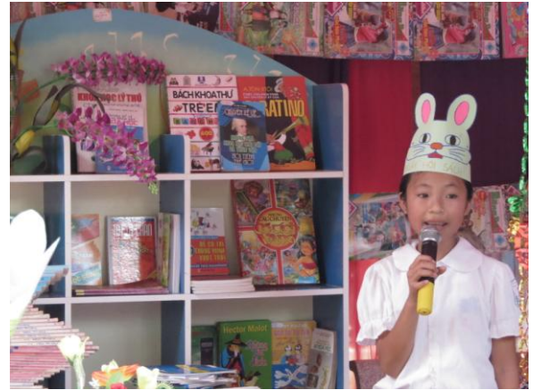
học sinh tham gia ngày Hội đọc sách