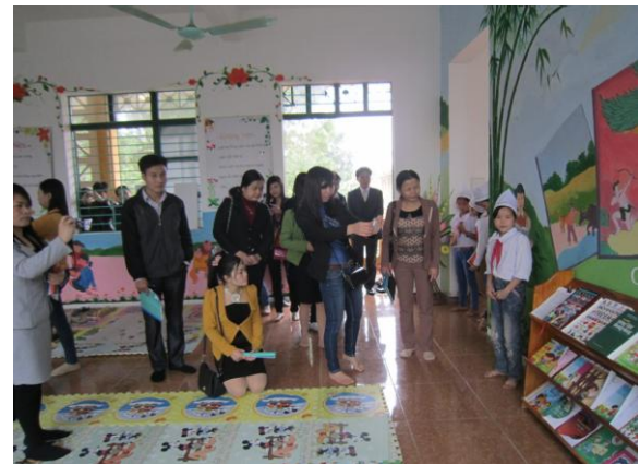
Đoàn CBGV tỉnh Hưng Yên đến thăm thư viện