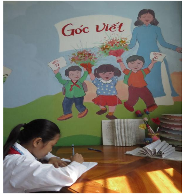
Hình ảnh: Bài cảm nhận của học sinh sau khi đọc truyện.

- Viết nhật ký đọc. Hướng dẫn các em viết vào cuốn nhật ký nhỏ, cuốn nhật ký sẽ ghi lại tên sách đã đọc, nội dung ý nghĩa của cuốn sách. Điều này rất bổ ích cho học sinh, nhìn vào cuốn nhật ký của mình các em sẽ biết được mình đã đọc được bao nhiêu cuốn sách và những giá trị cuốn sách mang lại, từ đó các em sẽ vận dụng vào cuộc sống.