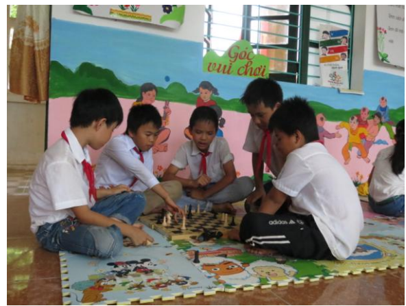
Học sinh tham gia tại "Góc vui chơi"