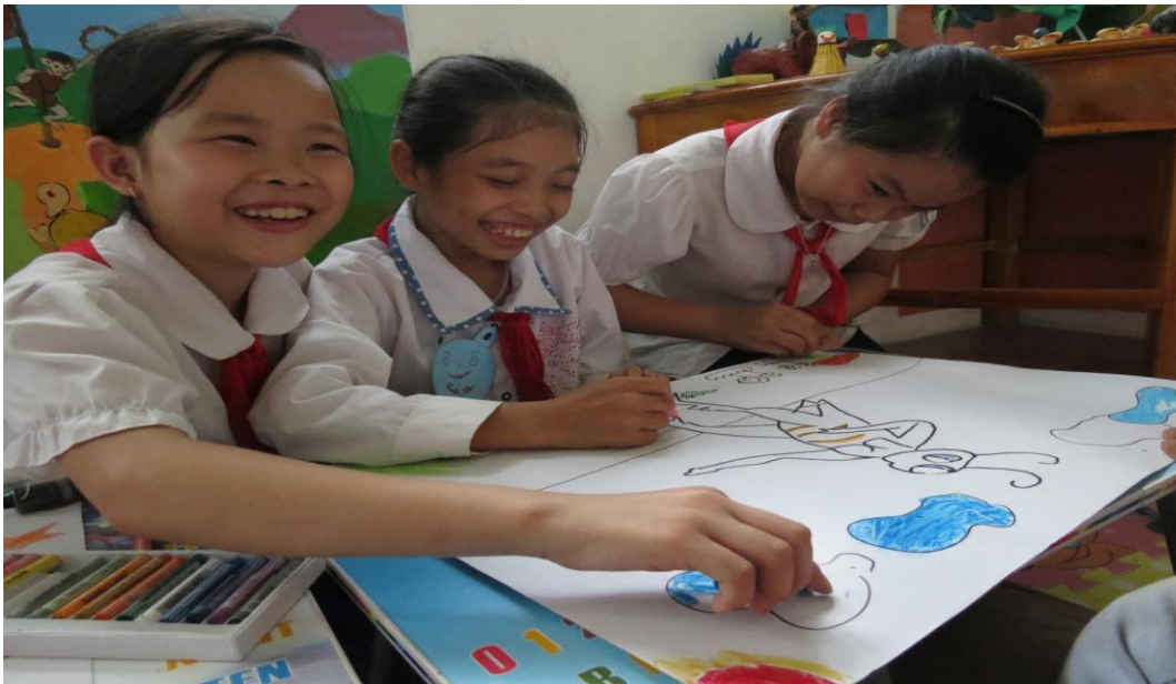
Hình ảnh: Học sinh thi vẽ tranh về nhân vật Dế Mèn.

Cho các nhóm thi vẽ tranh về Dế mèn , bình chọn nhóm vẽ đẹp.